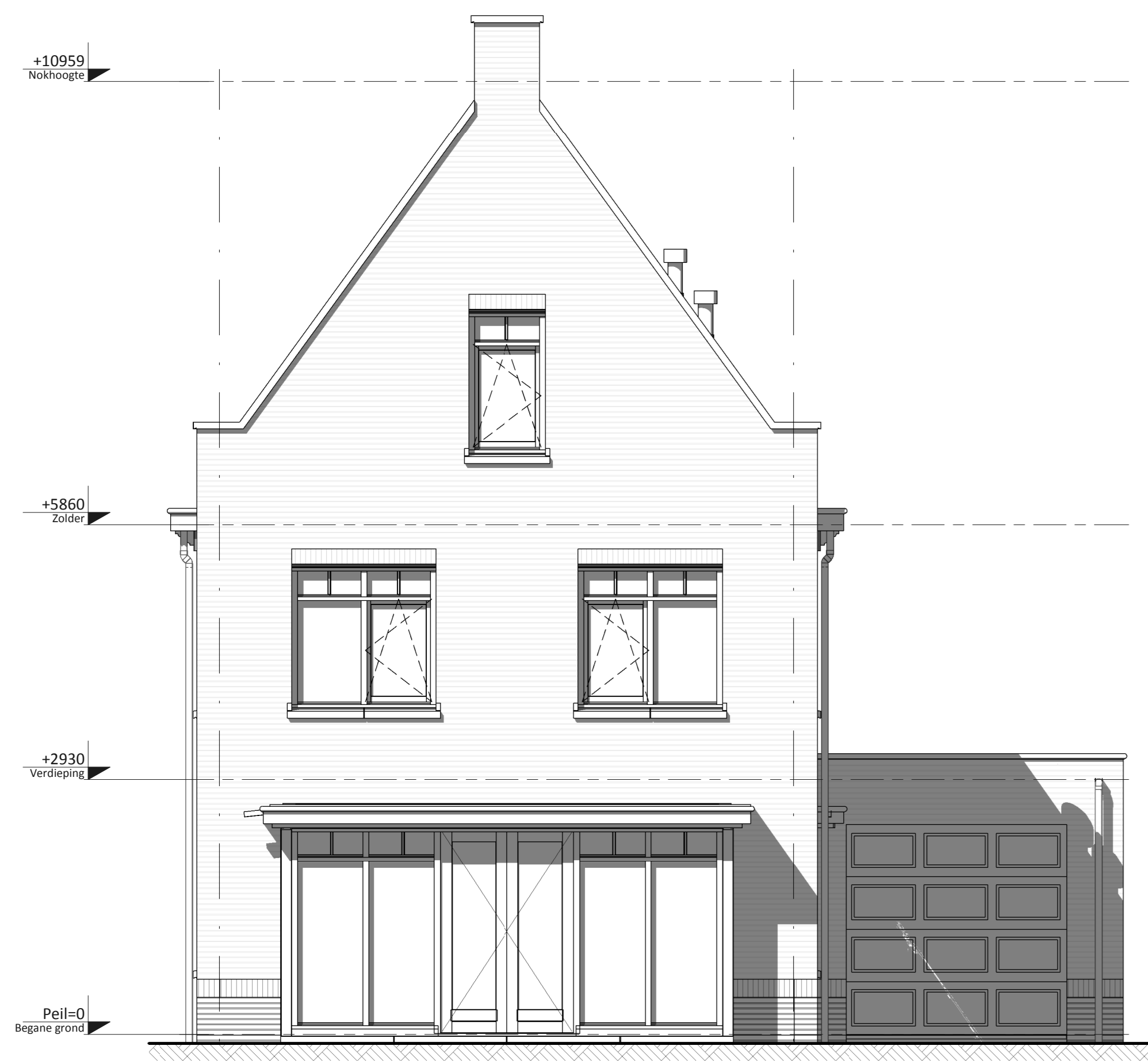
Voorgevel ① • Basis voorgevel ②