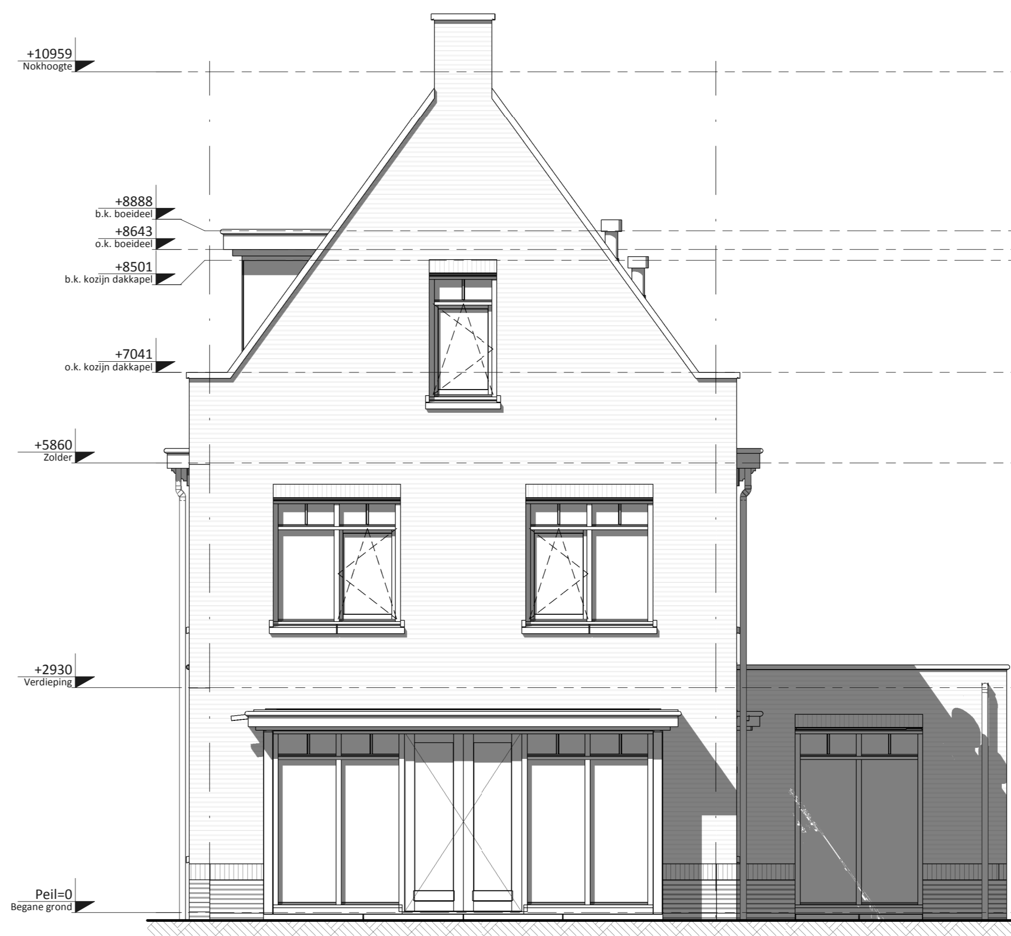
Voorgevel ① • Aanbouw 2,4m achtergevel, berging ② samenvoegen met woning en losse berging in tuin • Dakkapel tuinzijde