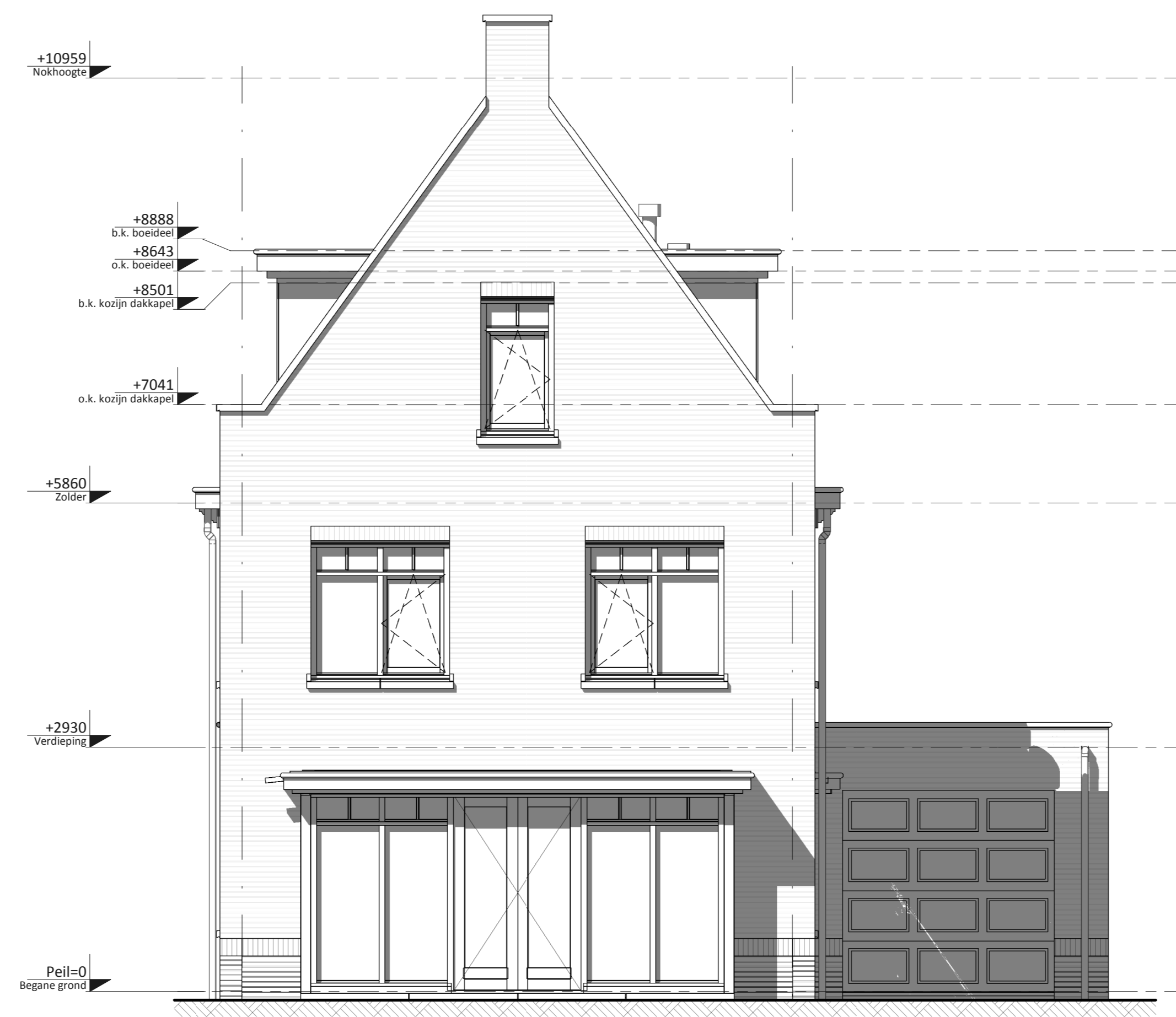
Voorgevel ① • Dakkapel tuinzijde • Dakkapel entreezijde ②