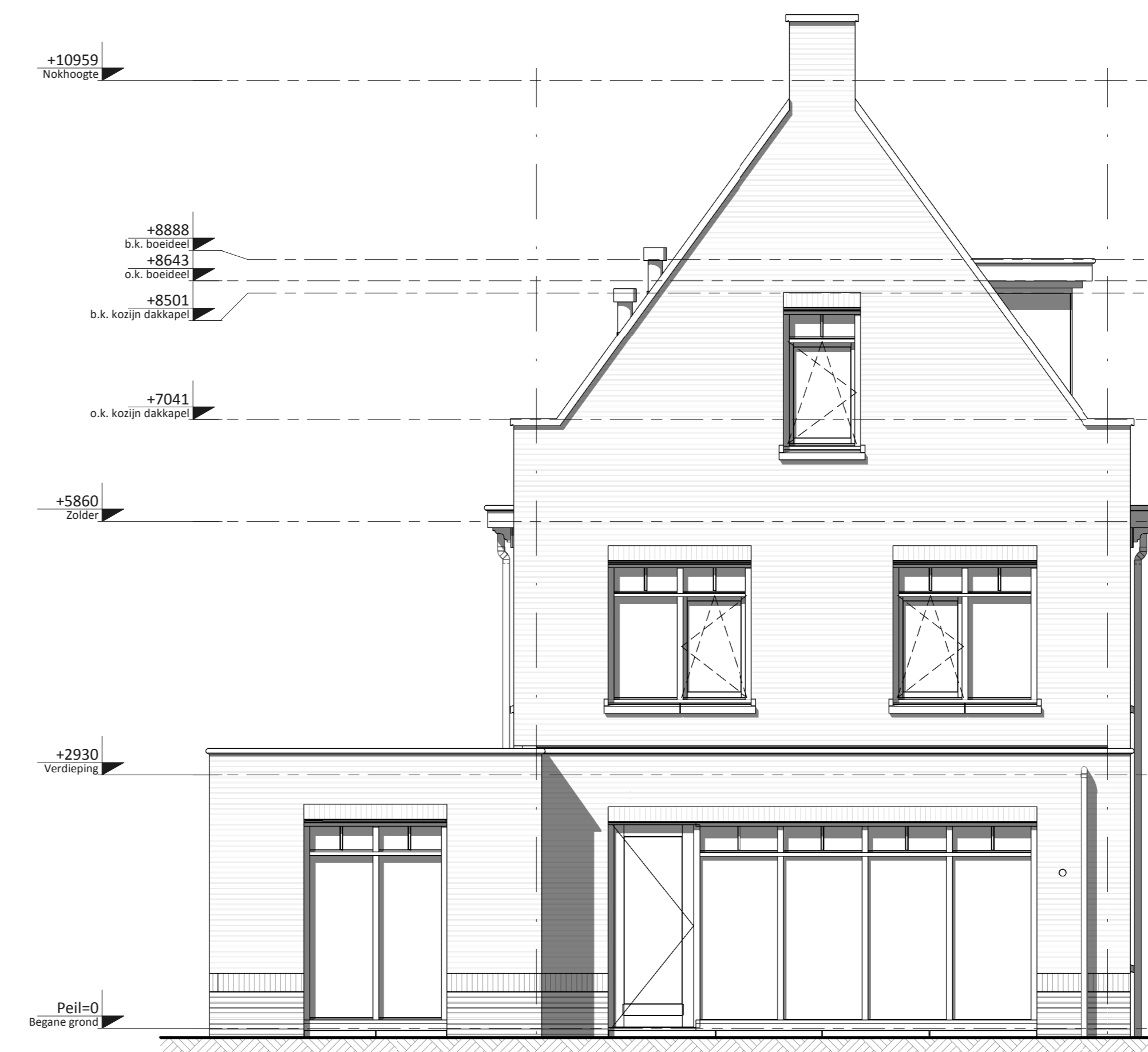
Achtergevel ② • Dakkapel tuinzijde • Brede gevelpui achtergevel • Aanbouw 2,4m achtergevel, berging samenvoegen met woning en losse berging in tuin ①

□ PV-panelen: aantal en situering indicatief (n.t.b. afhankelijk van EPC berekening)