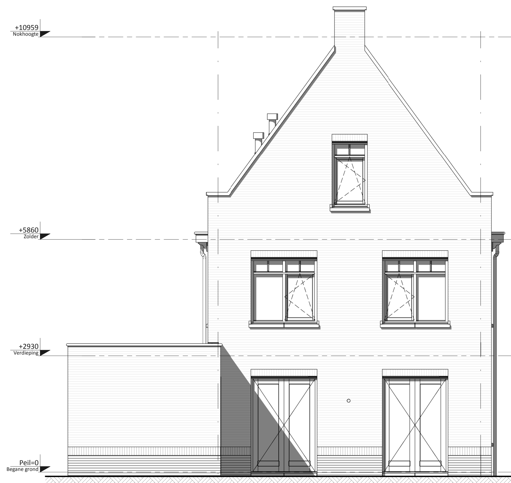
Achtergevel ② • Dubbele openslaande deuren naar tuin achtergevel i.p.v. enkele deur • Dubbele openslaande deuren naar tuin achtergevel i.p.v. vast glas kozijn ①